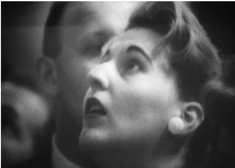
Ил. 1: Посетительница, рассматривающая экспонаты на советской выставке. (Кадр из фильма « Это видел Нью-Йорк », реж. Н. Соловьева, 1959)

Помимо чисто вербальных средств передачи реакции посетителей на выставки, режиссеры обоих фильмов прибегли к средствам кинематографическим. В советском фильме крайне распространены кадры, на которых посетители задирают голову, чтобы рассмотреть многочисленные экспонаты, размещенные выше человеческого роста (Ил.1). При этом субъективная камера демонстрирует, что может увидеть «восторженный американский зритель» наверху: макеты самолетов, вертолетов, первый в мире спутник и, наконец, портрет Ленина. И если подобная мизансцена с человеком, смотрящим вверх, может рассматриваться как некоторый лейтмотив фильма о выставке в Нью-Йорке, то человек, тянущийся к экспонату, будет аналогичным лейтмотивом выставки в Сокольниках (Ил.2).