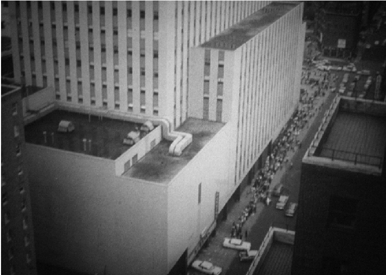
Ил. 3: Очередь в выставочный комплекс «Колизей», где проходит советская выставка. (Кадр из фильма «Это видел Нью-Йорк», реж. Н. Соловьева, 1959)

особого дополнительного усиления вербальными средствами, то в случае советского фильма ситуация прямо противоположная: диктор использует такие эпитеты, как «громадная», «бесконечная» очередь, хотя визуальная репрезентация подобных сцен противоречит вербальным комментариям (Ил.3).