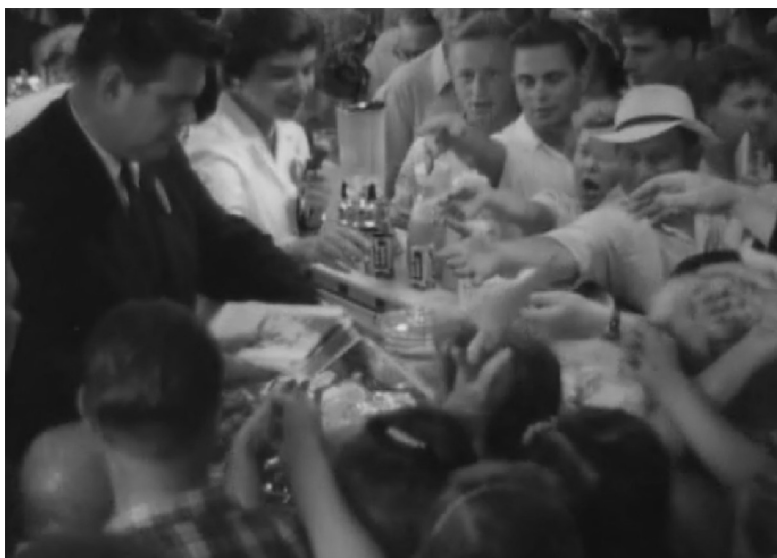
Ил. 2: Советские посетители, тянущие руки к американскому гиду, раздающему полиграфическую продукцию. (Кадр из фильма «Opening in Moscow», реж. ДА. Пеннебейкер, 1959)

Тема популярности представленных на АНВ предметов среди советских людей неоднократно поднимается в фильме Пеннебейкера. Когда гид рассказывает о реакции посетителей на фотоаппарат «Полароид», он упоминает, что многие ждали до семи часов в очереди, чтобы получить свой снимок. Эти воспоминания сопровождаются соответствующими кадрами, демонстрирующими ажиотаж вокруг моментальной фотографии. Аналогичные кадры мы встречаем и в сценах с раздачей «Пепси», в сценах, снятых, в книжном павильоне и многих других секциях АНВ. В американском фильме неоднократно приводится тезис о том, что посетители АНВ проявляли живой интерес к американцам и всему американскому. На 36 минуте Винн вспоминает, что люди смотрели на нее везде, где она была, потому что она – американка. А на 42 минуте фильма видно, как советские люди не покидают Сокольники, несмотря на начавшийся ливень.