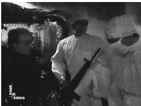
Кадр 9: В постапокалиптическом мире центрального бункера