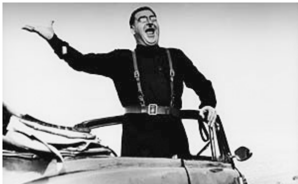
Кадр 5: Образ Варлама Аваридзе харизматичен и объединяет в себе черты многих тиранов.

ки и не подозревают о преступлениях, совершенных их уважаемыми дедами. В «Покаянии» внук диктатора — молодой человек, выросший в полном неведении относительно деятельности деда. Он узнает о страшной вине Варлама в ходе процесса над разорительницей могилы, когда она, вспоминая свое детство, рассказывает о страшном терроре, жертвами которого стали ее родители. Воспитанный, получивший хорошее образование юноша приходит в ужас от страшной правды, и еще больше его поражает поведение собственных родителей, которые пытаются обличить обвиняемую во лжи, обвинить ее в потере рассудка и отправить в сумасшедший дом. Это среднее поколение, выросшее в СССР и составившее основу партийной номенклатуры в брежневские времена, в своей борьбе с неудобными людьми опирается исключительно на силу власти. В конце фильма внук Варлама совершает самоубийство из-за страшного сознания того, что на его руках кровь миллионов, а его отец продолжает оправдывать преступления, совершенные дедом. Высоконравственный юноша гибнет, не сумев пережить удар от сознания зла, совершенного его дедом и отцом. Главная идея фильма касается сохранения памяти и уважения к трагическим страницам прошлого страны и признания жертв сталинского террора. Особенно автора волнует восприятие тех событий молодым поколением. Фильм выступает против забвения страшных событий прошлого и призывает к традиции христианского покаяния. Человеческий суд на земле — лишь жалкая репетиция Страшного