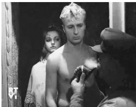
Кадр 16: ...и его народ