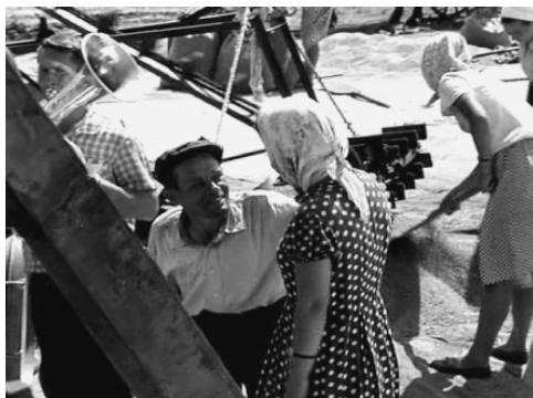
Фото. 1. Кадр из фильма «История Аси Клячиной...» Это реальные люди, а не выдуманные персонажи, они играли в этой картине вместе с профессиональными актерами

Здесь в художественный фильм вводятся «документально» снятые эпизоды: «неигровые фрагменты и монологи непрофессиональных актеров <...> звуковое пространство организуется при помощи введения в звуковую дорожку фильма нечетких обрывков разговоров» [Дашкова, 2008. С. 161], инструментальной музыки и пения непрофессиональных исполнителей; сам режиссер называл его сюрреалистической сказкой в хроникальной манере [А. Михалков-Кончаловский о фильме... 2007].