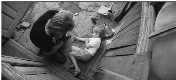
Кадр 11: Прямая перспектива съемки и визуальные метафоры, содержащиеся в религиозных настенных росписях, продолжают традицию Тарковского