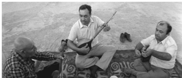
Кадр 12: Азиатская традиция...

шум самых разных языков: туркменского, русского и татарского, отрывок мессы на латинском, из невыключенного проигрывателя звучит радиозапись объявления немецкой народной песни «Мельник любит пешие прогулки» на английском языке. Наконец, когда гаснет солнце, спадает утомительная жара и туркменская глухомань погружается во тьму, приходит понимание близости конца существования таких разных культур, искусственно объединенных советской идеологией.