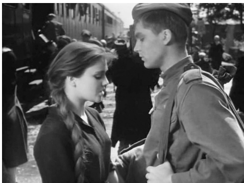
Кадр 6: Советская молодежь времен «оттепели» («Баллада о солдате», 1959)...

Школа и советская система воспитания основаны на зазубривании бессмысленных фраз, коммуникативные возможности и потребности человека в современном мире минимизируются, проблемы взаимопонимания разделяют как отдельных людей, так и разные социальные слои и даже нации многонационального Советского государства. Пессимистические размышления о кризисе культуры свойственны именно перестроечному кино, у фильмов эпохи «оттепели» были другие задачи. Предложенные «оттепелью» конструктивные и оптимизирующие решения общественных и личных конфликтов были в резкой форме отвергнуты лентами перестроечного времени. Социалистическая идеология перестала быть политической платформой, объединяющей и примиряющей абсолютно разных людей. Модель счастливого коллективного существования в перестроечных фильмах заменили на модель индивидуального существования, которая в самой негативной форме своего проявления отражает одиночество и безразличие. Расставшиеся со своими иллюзиями и оторвавшиеся от коллектива герои 1960-х и ранних 1980-х в одиночку оказываются перед непростыми задачами и рассчитывают только на свои силы.