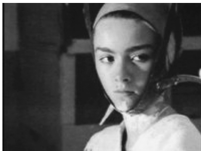
Фото 5. Кадр из фильма «Это было у моря»

нат, избегают своих сверстниц в специальных белых воротниках: «А что, у вас тут все в намордниках?»»