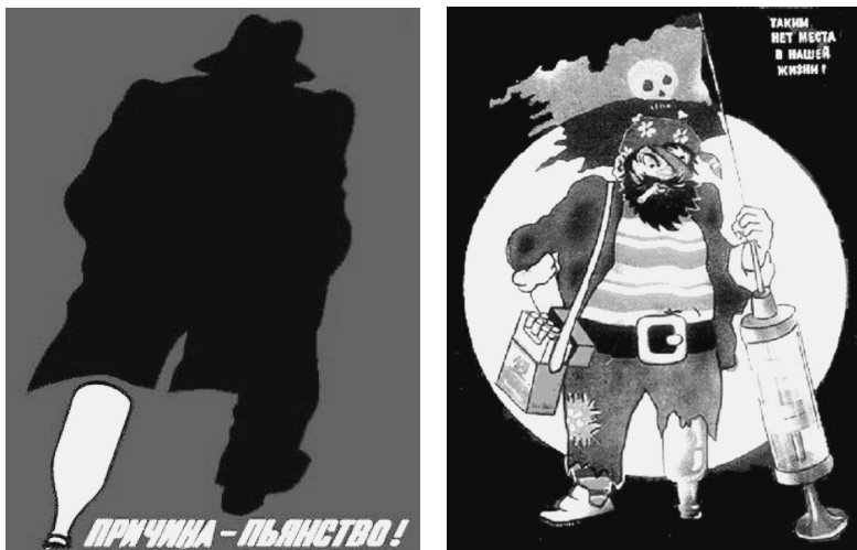
Фото 3. Плакаты времен антиалкогольной кампании 1980-х гг. Инвалидность показана как личная вина

Только железный человек может выжить, пройти через то, что ему довелось, оставаясь примером, вдохновляющим других à la герой-мученик» [Alaniz, 2007], подобно Корчагину, Мересьеву или Воропаеву 1 . Помимо героики войны и труда в визуальном дискурсе звучат и обвинительные ноты, например, в антиалкогольных плакатах 1980-х гг. встречаются образы личной безответственности, которая показана причиной инвалидности и последующего социального исключения (фото 3).