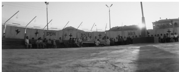
Кадр 14: ...находятся по отношению друг к другу в неразрешимом конфликте