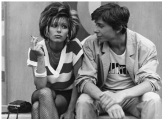
Кадр 7: ...и в перестроечные времена («Маленькая Вера», 1989)

Фильм Василия Пичула «Маленькая Вера» (1988), сильно напоминающий молодежные фильмы 1960-х гг., посвящен молодой героине в поиске своей идентичности. Характер персонажей фильма, выбор места действия, шокирующая эстетика в манере подачи событий позволяют отнести эту картину к кинематографу перестроечного времени, несмотря на тот факт, что главная героиня совсем не является аутсайдером в коллективе: она обычная выпускница школы из среднестатистической советской рабочей семьи. Вера живет со своими родителями в Жданове, унылом индустриальном городе на юге Украины. Ее отец — водитель грузовика, человек болезненный и пьющий, мать — рабочая текстильной фабрики, тоже болезненная и постоянно бранящаяся. Их дочь Вера окончила школу, не имеет никаких дальнейших жизненных планов, ее интересы поверхностны, она диковата, находит удовольствие в сексе и во всем том, что раздражает и сердит ее родителей. Вера заводит отношения с красавчиком Сергеем из более интеллигентной и обеспеченной семьи, ее родители принимают его у себя дома на правах будущего зятя. Однажды разногласия между отцом Веры и другими членами семьи приводят к тому, что отец ранит Сергея ножом в живот. На суде отец вынуждает дочь свидетельствовать против молодого человека. Вере тяжело справиться с совершенным предательством, и она пытается уйти из жизни.