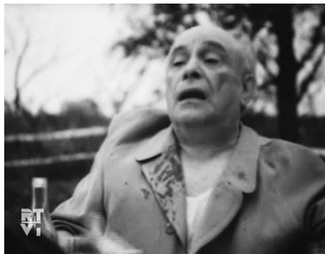
Кадр 15: Властитель (Ролан Быков)...

несено в название фильма и вербально характеризует общую неуверенность перестроечного времени. Поверхностное действие картины происходит в ускоренном темпе: «Оно» рассказывает, подобно Салтыкову-Щедрину, историю вымышленного города, его обывателей и прежде всего историю его властителей. Жители города угнетены, их избивают, эксплуатируют, хотя иногда у них ищут пристанища любвеобильные незнакомки, их увещевают обещаниями лучших времен и великих реформ, в то время как городские управленцы преуспевают в расхищении городской казны и неумелом планировании. За грубым тираном следует фанатично увлеченный выращиванием горчицы правитель с манерами крестьянина, за ним — безмозглый с музыкальными часами в голове, затем амбициозный обновленец, берущий курс на в высшей степени неясное будущее.