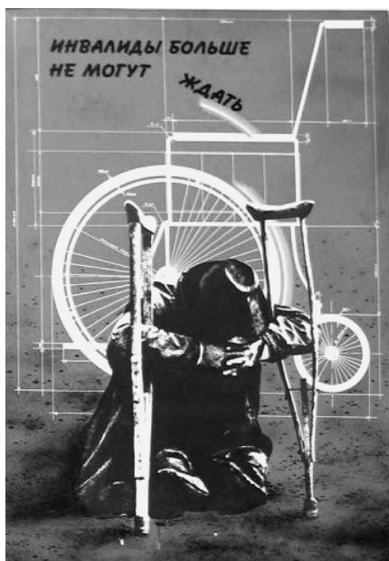
Фото. 2. Художник О. Качер «Инвалиды больше не могут ждать». Плакат 1988. Инвалид изображен в ожидании коляски вместо костылей

Создаются документальные фильмы и телепередачи («Мой дом — моя крепость», 1988) о тяготах жизни инвалидов среди ветеранов-«афганцев», плакаты (фото 2), несущие сообщение о несправедливом устройстве общества как причине страданий инвалидов, однако отнюдь не всегда в этих текстах инвалиды представлены субъектами права и собственного выбора. Так, на плакате О. Качер инвалид изображен в ожидании коляски, которая должна быть спроектирована и выдана ему на смену костылям, а проблемы доступности образования, занятости, условий отдыха и лечения, как видим, здесь не поднимаются.