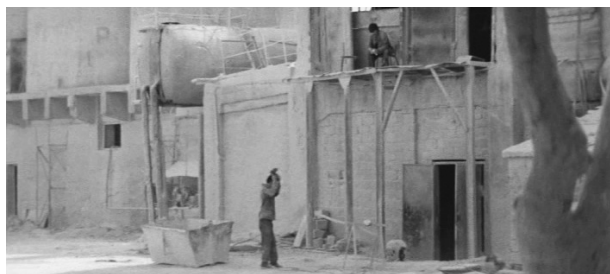
Кадр 13: ...и современная советская...